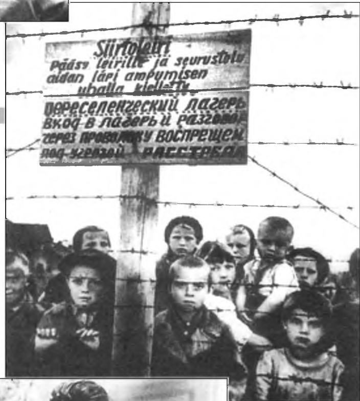
Снимок «Узники фашизма», сделанный в только что освобождённом от врага Петрозаводске и вошедший в золотой фонд советской фотопублицистики.