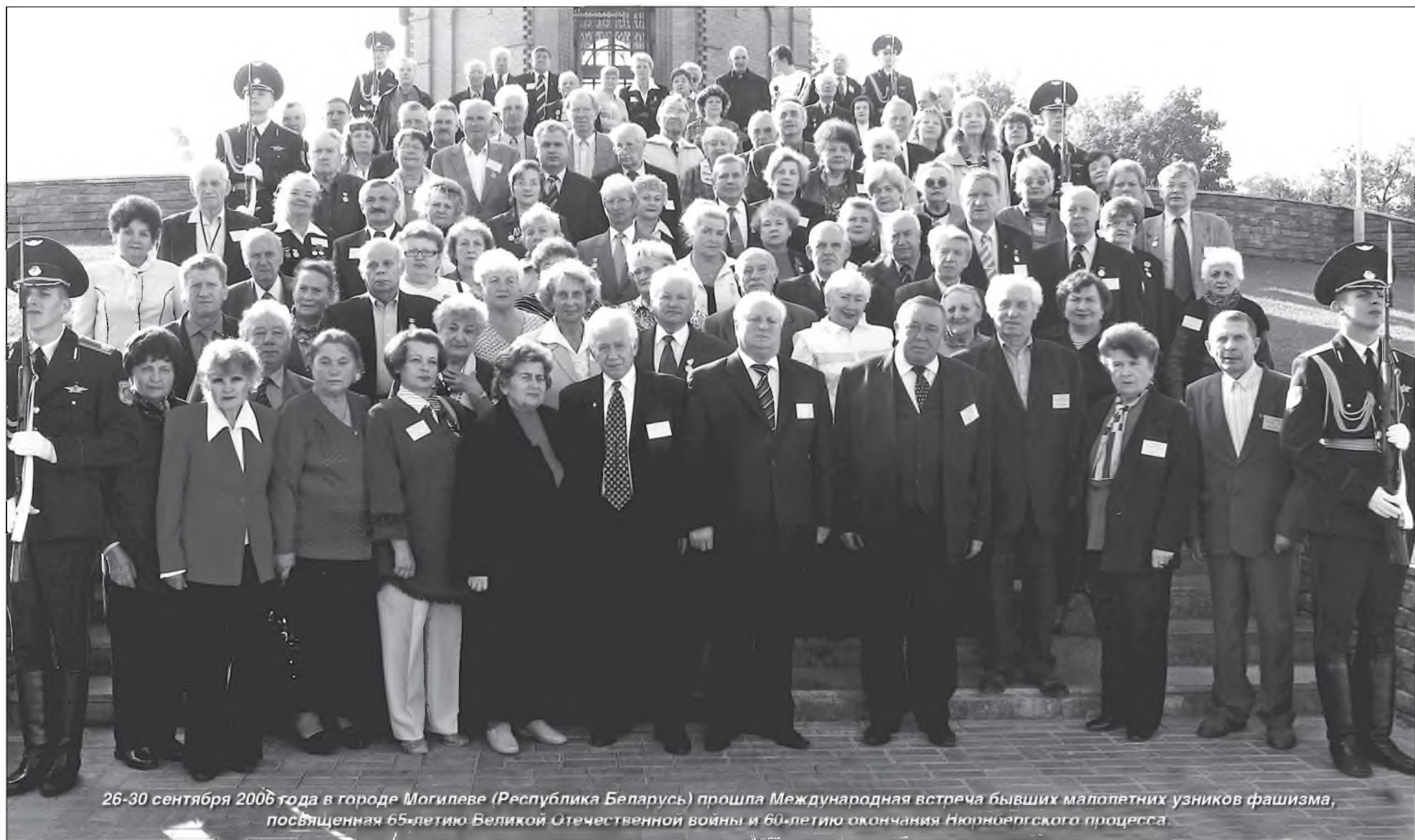
26-30 сентября 2006 года в городе Могилеве (Республика Беларусь) прошла Международная встреча бывших малолетних узников фашизма, посвященная 65-летию Великой Отечественной войны и 60-летию окончания Нюрнбергского процесса.

Мемориал, посвященный детям – жертвам войны в деревне Красный Берег Жлобинского района – это «скорбь по мертвому классу». В 1944 году накануне отступления нацисты организовали в этой деревне сборный пункт для белорусских детей от 8 до 14 лет. В немецком мемориальном комплексе Равенсбрюк, созданном на территории бывшего женского концлагеря, открыта мемориальная доска от имени Президента Республики Беларусь в память о погибших здесь белорусских узниках. В фонде «Взаимопонимание и примирение» создан музей под открытым небом из вагонов теплушек, в которых фашисты угоняли наших соотечественников в Германию.