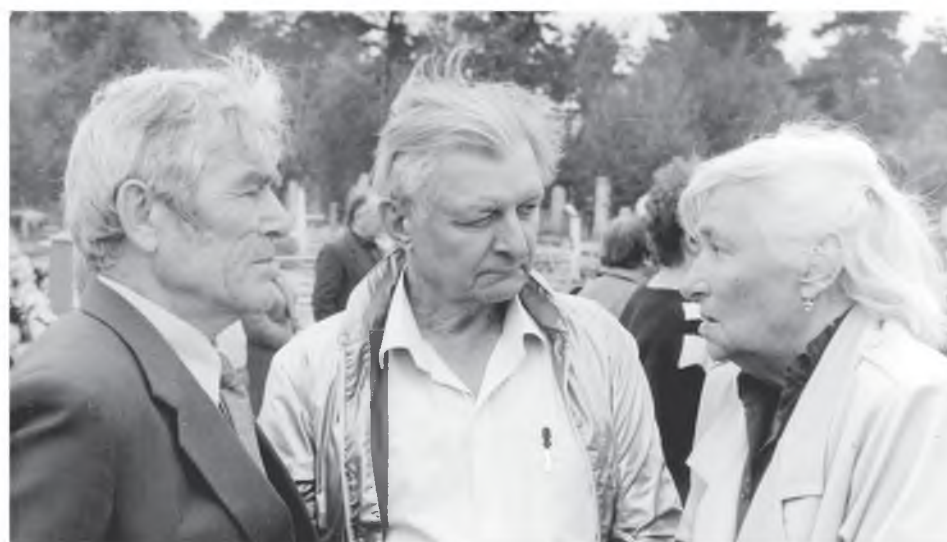
С первого выпуска поддержку «Судьбе» оказывают узники Маутхаузена и лично президент международного комитета Ф.С. Солодовник (в центре). Этим жива «Судьба»!