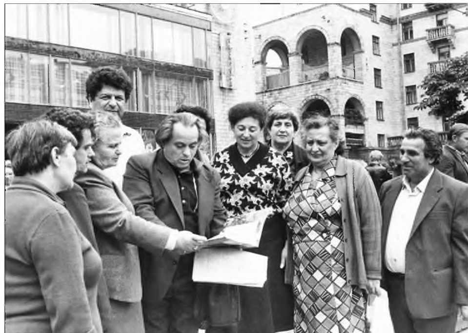
На киевской земле встретились бывшие узники Печерского концлагеря (Винницкая область). Фотографии А. МАЛАХОВСКОГО (Фотохроника ТАСС) переданы в «Судьбу» по просьбе редакции