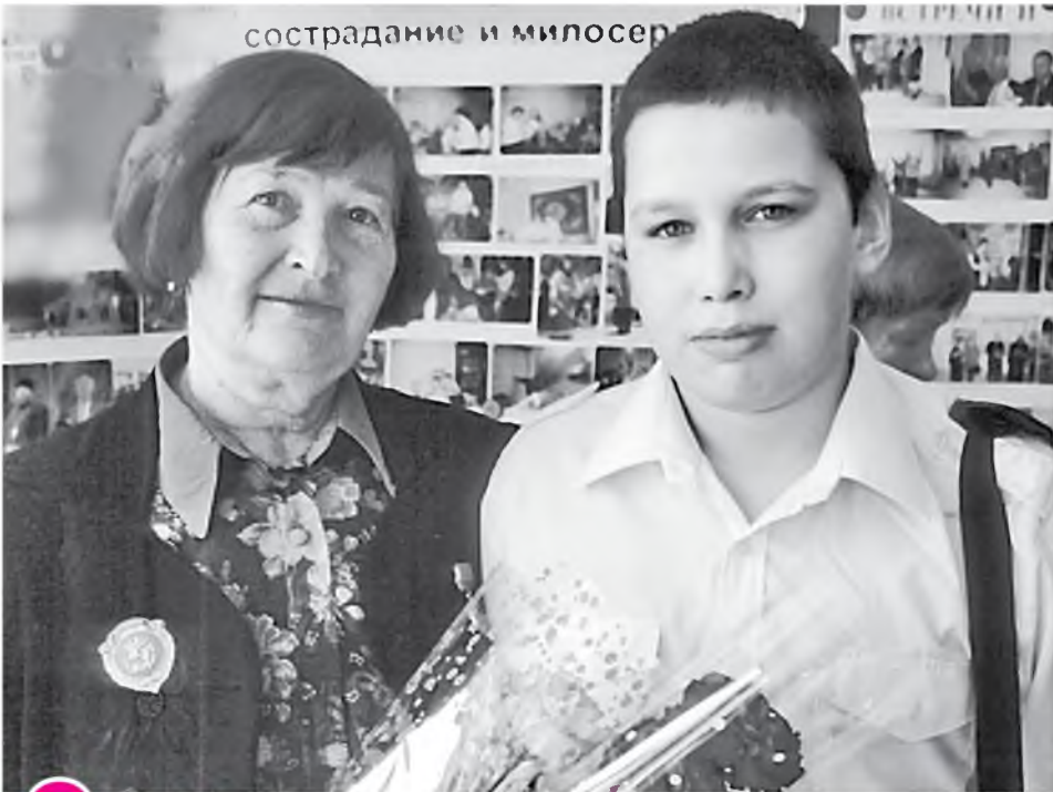
сострадание и милосердие

Международный союз бывших малолетних узников фашизма разослал приглашения для участия в международной конференции.