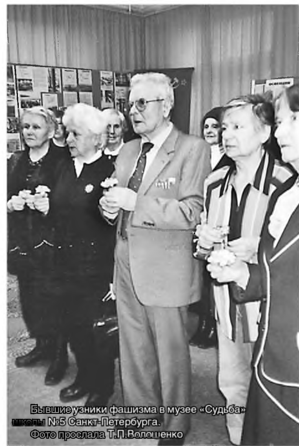
Бывшие узники фашизма в музее «Судьба» школы №5 Санкт-Петербурга.

все свои ордена и медали, и что? Рассказывать ребятам, за что я их получил, думаю, не интересно». Как