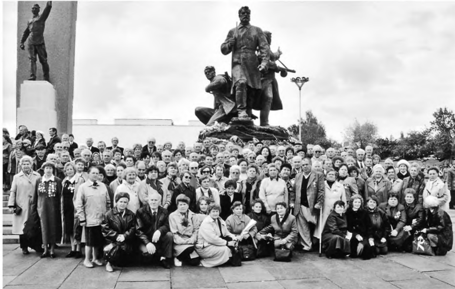
Брянск, Площадь партизан, 17 сентября 1999 года. Центральный Совет Международного союза бывших малолетних узников фашизма принимает Заявление Президенту Российской Федерации, Федеральному Собранию Российской Федерации, Правительству Российской Федерации «Прекратить террор в России!»