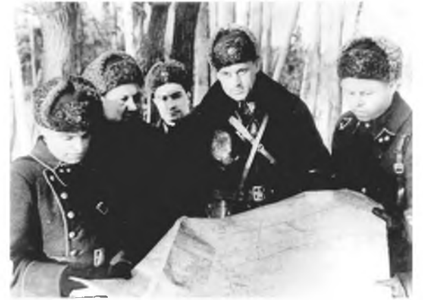
В декабре 1941 года, Подмосковье. Крайний справа начальник штаба 16а М.С. Малинин, посреди К.К. Рокоссовский, крайний слева командующий артиллерией армии В.И. Казаков

... Для установления полной картины зверств