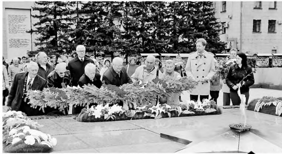
Участники конференции, руководители Международного союза бывших малолетних узников фашизма и национальных объединений жертв нацизма Республики Беларусь, Украины и Российской Федерации возлагают венки к Вечному огню Мемориала города Иркутска