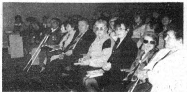
В зале пленарного заседания ЦС МСБМУ.

Участники пленума ЦС МСБМУ высоко оценили сердечное внимание и душевное тепло, которые были проявлены к ним во время работы в Брянске - партизанской столице России.