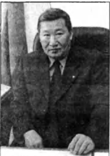
Геннадий Архипович Айдаев - мэр нашего города Улан-Удэ. До сих пор мы, бывшие малолетние узники фашизма, с ним не встречались - нужды не было.

ПОЧЕМУ ЖЕРТВЫ НАЦИЗМА ПОВСТРЕЧАЛИСЬ С ЭТИМ ЧЕЛОВЕКОМ И ЧТО ОН ИМ ПОСОВЕТОВАЛ