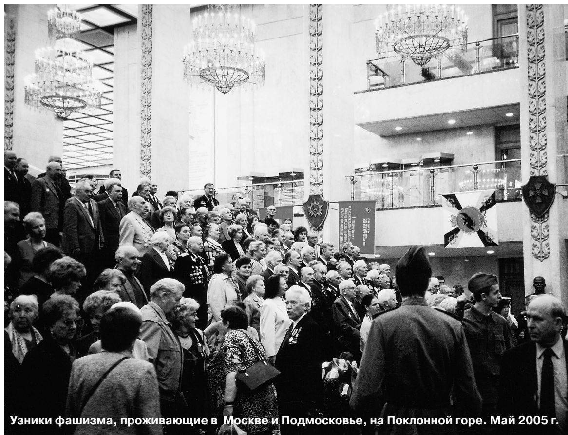
Узники фашизма, проживающие в Москве и Подмосковье, на Поклонной горе. Май 2005 г.