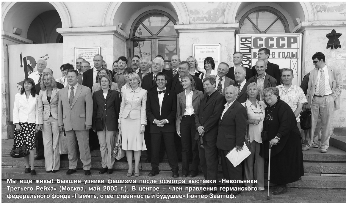
Мы еще живы! Бывшие узники фашизма после осмотра выставки «Невольники Третьего Рейха» (Москва, май 2005 г.). В центре - член правления германского федерального фонда «Память, ответственность и будущее» Гюнтер Затгоф.