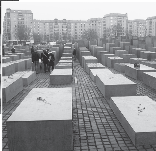
Мемориал «Жертвам холокоста». И здесь бывали те, кто чудом уцелел в годы войны. «Судьба».