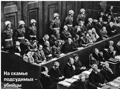
На скамье подсудимых - убийцы